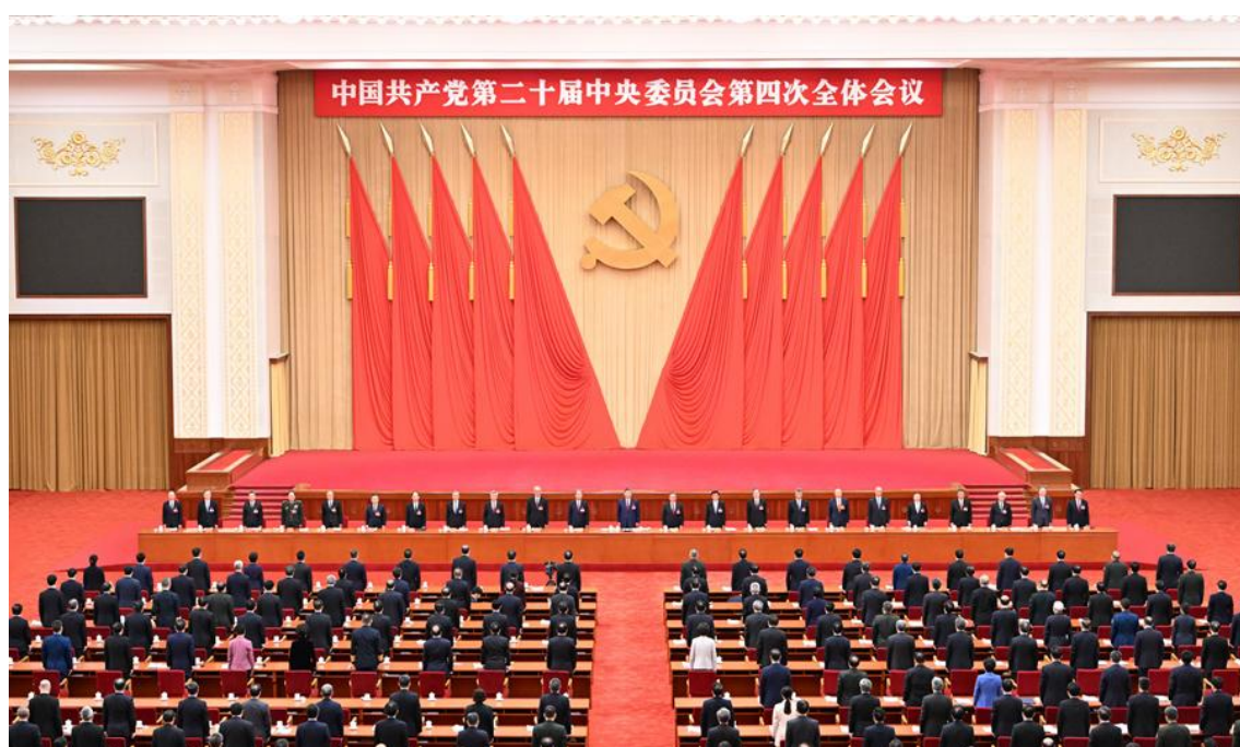
中国共产党第二十届中央委员会第四次全体会议，于2025年10月20日至23日在北京举行。

全会提出，建设现代化产业体系，巩固壮大实体经济根基。坚持把发展经济的着力点放在实体经济上，坚持智能化、绿色化、融合化方向，加快建设制造强国、质量强国、航天强国、交通强国、网络强国，保持制造业合理比重，构建以先进制造业为骨干的现代化产业体系。要优化提升传统产业，培育壮大新兴产业和未来产业，促进服务业优质高效发展，构建现代化基础设施体系。